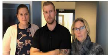
Föräldrar och skola rasar. Ungdomsmottagningarna och ungdomspsykiatrin ställer sig bakom protesterna.