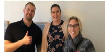
Föräldrar och skola upplever minskad oro hos barnen. Belastningen inom vården har minskat. Andra regioner och kommuner kontaktar Region Uppsala för råd.