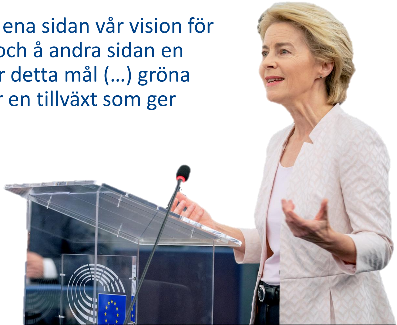
EU-kommissionens ordförande Ursula von der Leyen

”Den europeiska gröna given är å ena sidan vår vision för en klimatneutral kontinent 2050 och å andra sidan en mycket målmedveten vägkarta för detta mål (...) gröna given är vår nya tillväxtstrategi för en tillväxt som ger mer än vad den tar”