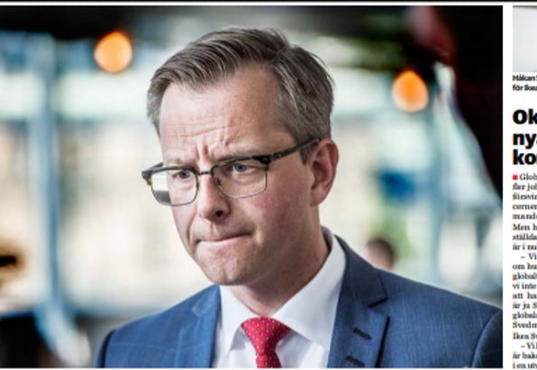
”Vi måste skaffa oss en bild av situationen i Skåne”, säger näringsminister Mikael Damberg.