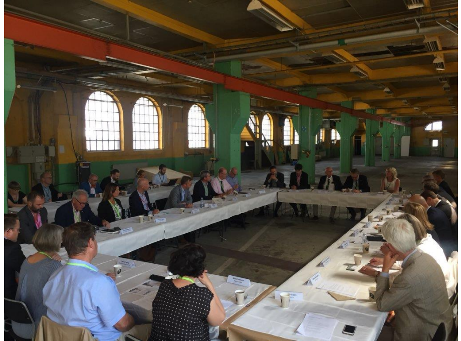
FIRS-möte med besök av Mikael Damberg