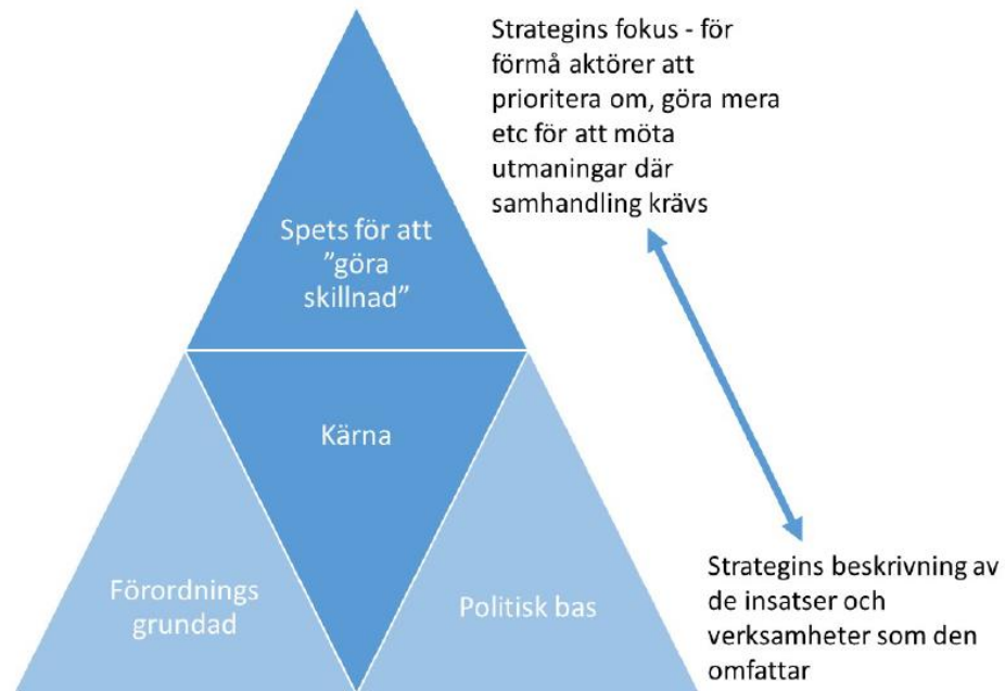
FIGUR 1 STRATEGINS OLIKA SYFTEN – MELLAN KÄRNA OCH SPETS

Vad säger idealtypen om RUSen som styrinstrument i din region?