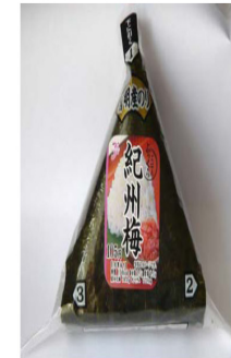
Rice Ball ( Onigiri ) Wrapped with easy-tear film