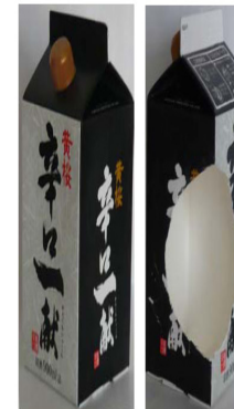
Rice Wine ( Sake ) in no-foil barrier carton