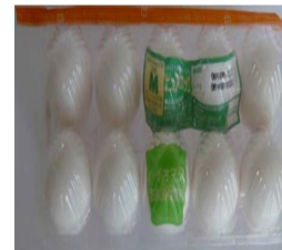
Fresh egg PLA or r-PETTray