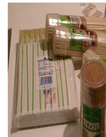
Chopsticks ( Hashi ) in Pouch with Wasaouro