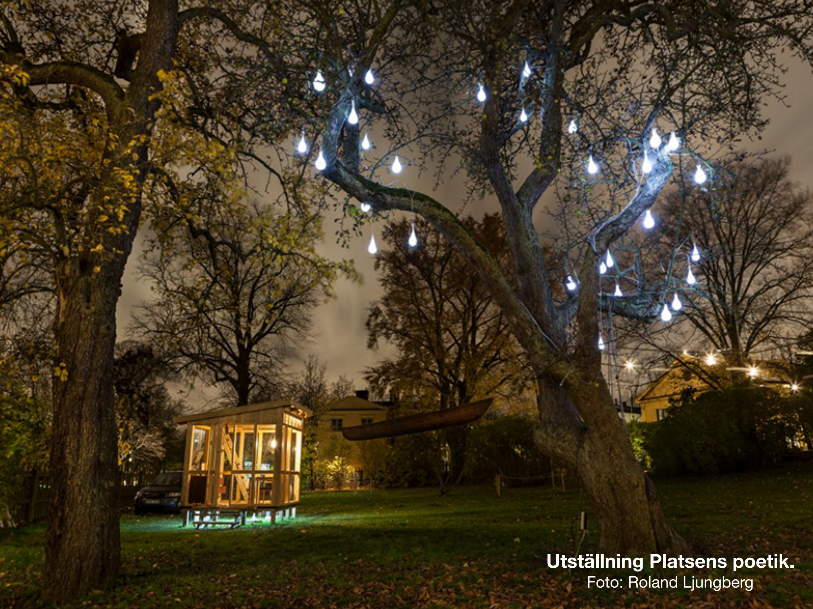
Utställning Platsens poetik.