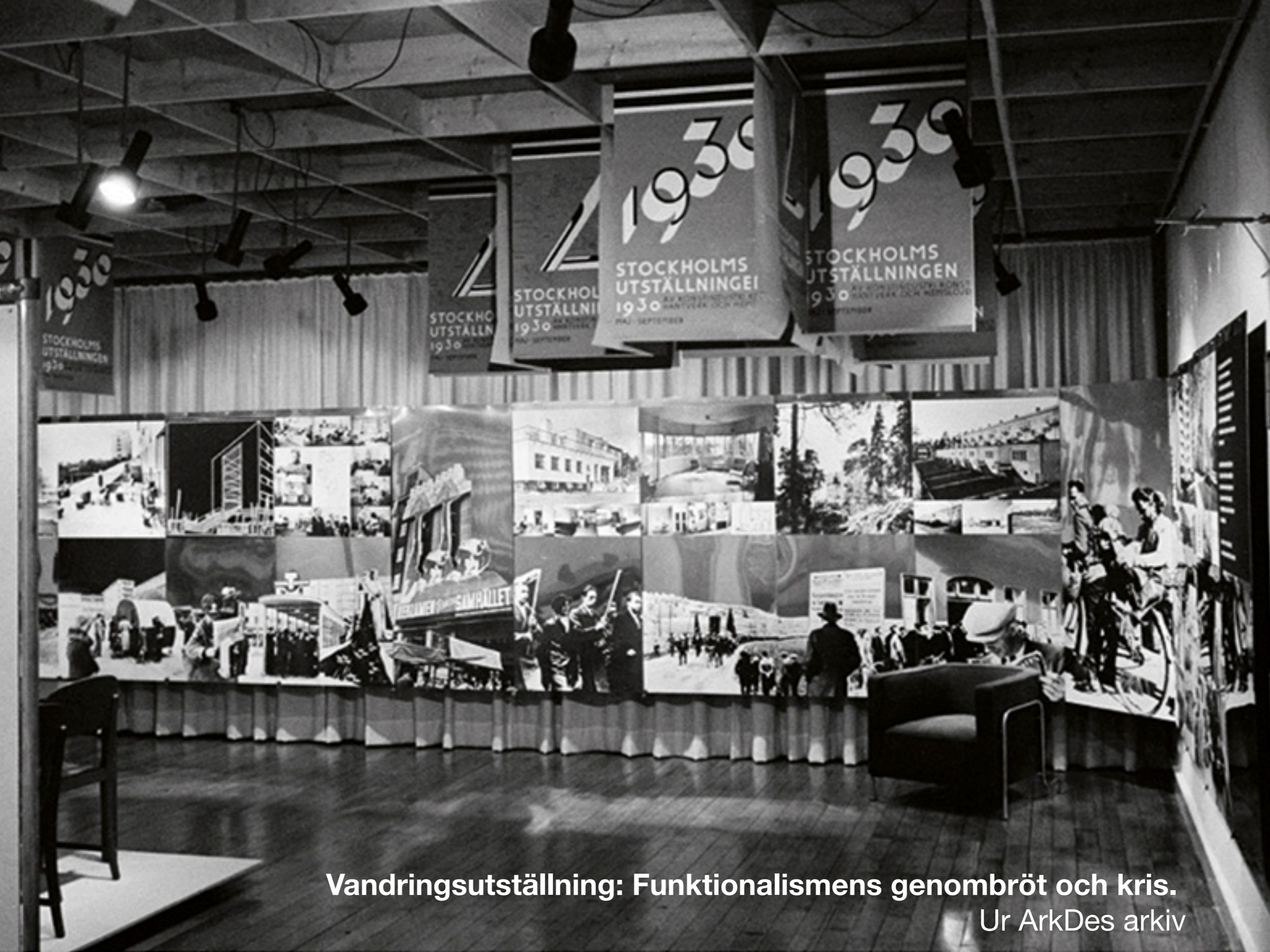
Vandringsutställning: Funktionalismens genombröt och kris. Ur ArkDes arkiv