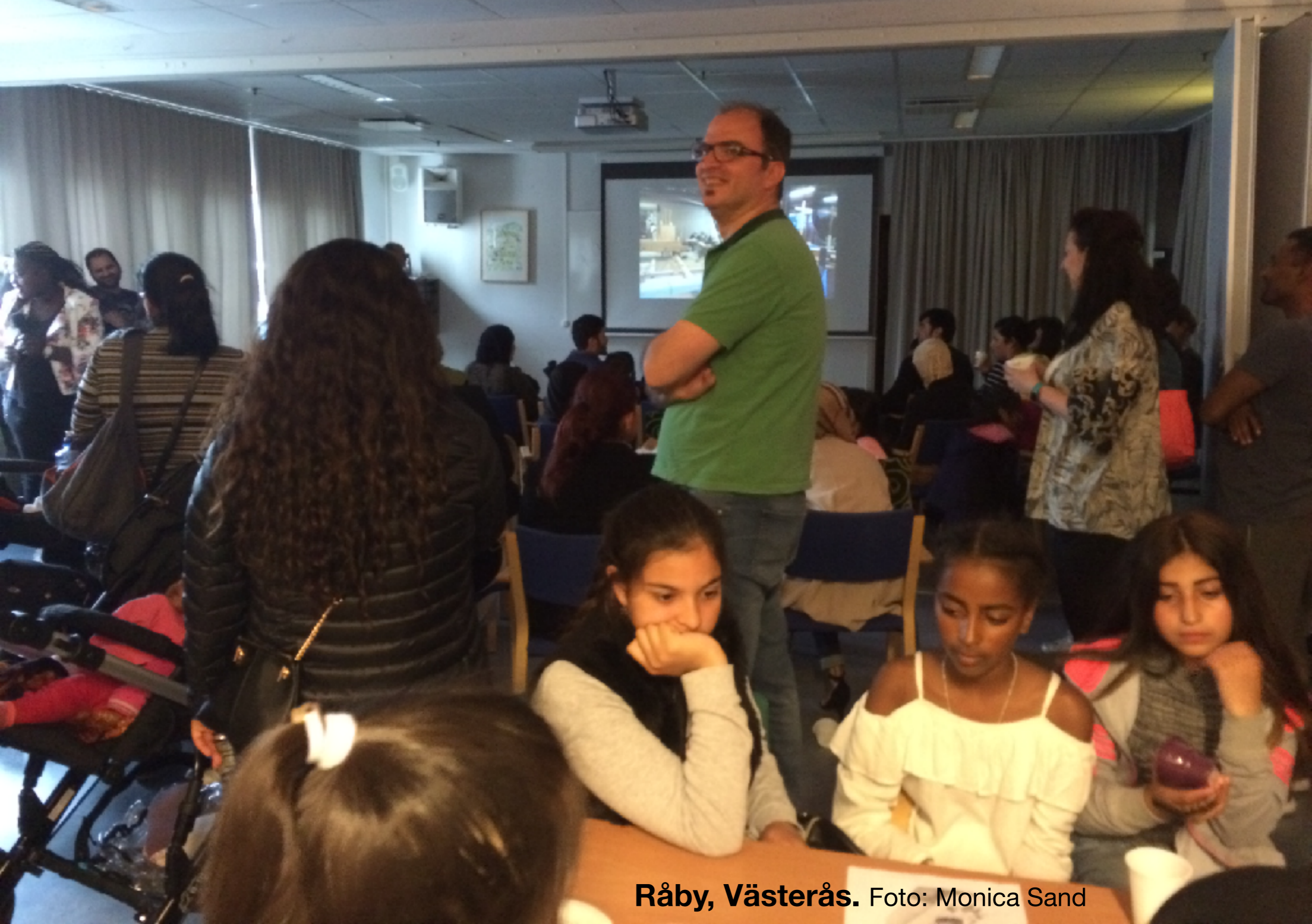
Råby, Västerås.

Invånare = beställare och användare av samhällsbyggande/service/infrastruktur